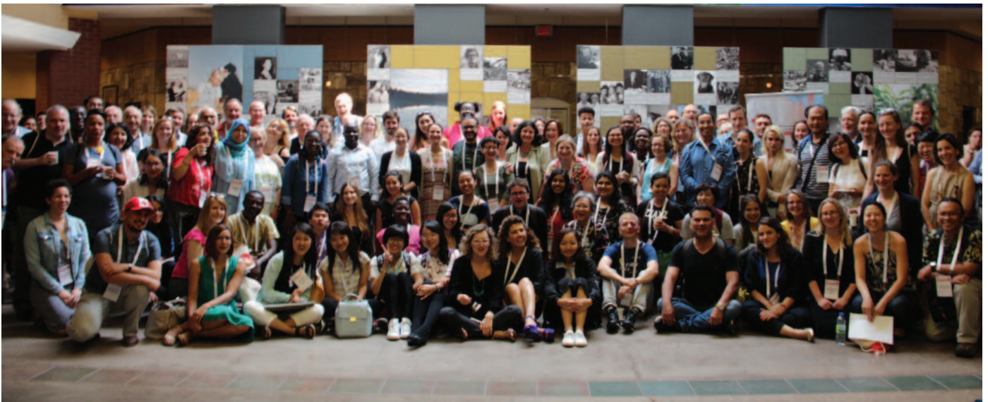
Delegates at the 2018 Congress of the International Association for the Cross-Cultural Psychology, Guelph University

The next Congress of the International Association for Cross-cultural Psychology will be held in Olomouc, Czech Republic in 2020.